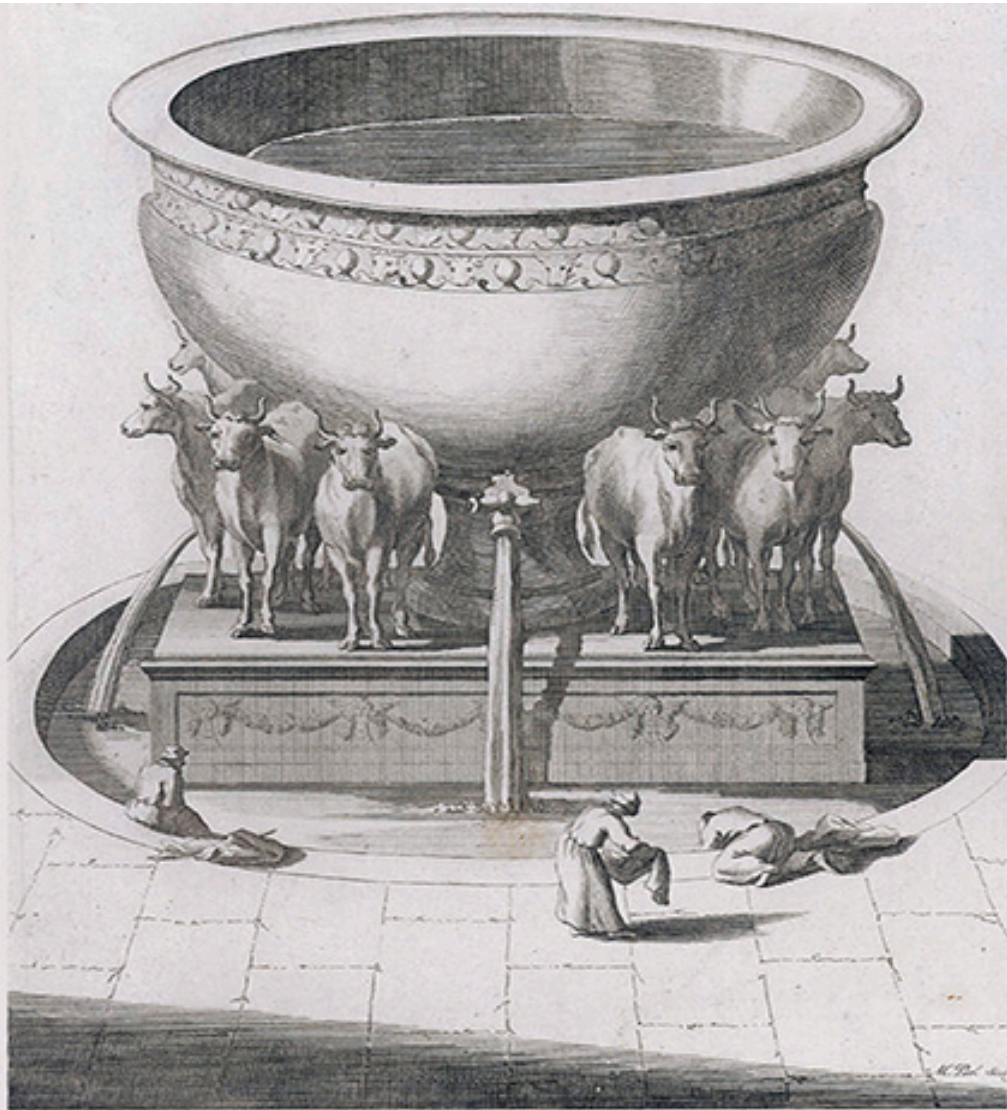
THE BRAZEN SEA IN SOLOMON'S TEMPLE