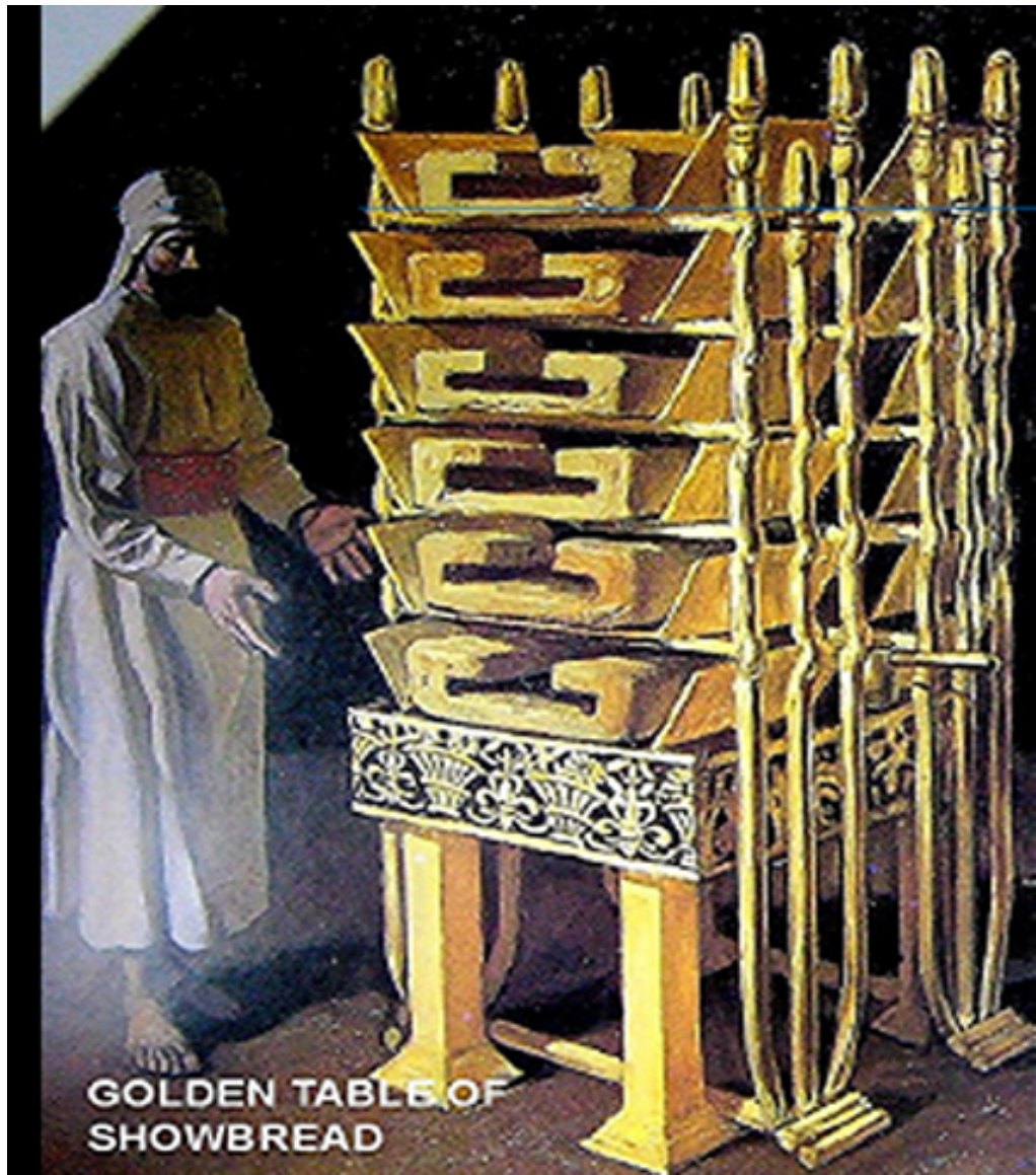
GOLDEN TABLE OF SHOWBREAD